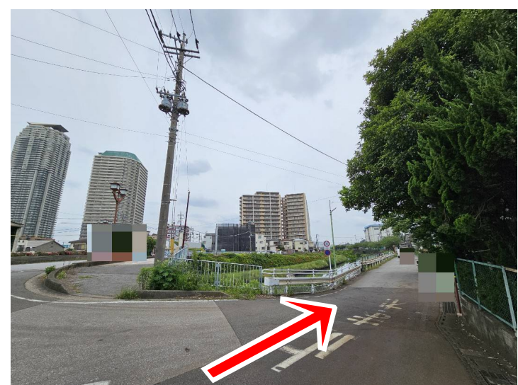
⑦ 『門樋橋』手前を右折する。 Turn right in front of MONPI Bridge.