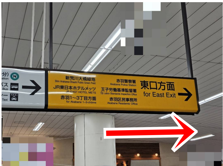
② 東口方面に進む。 Proceed towards the East exit.