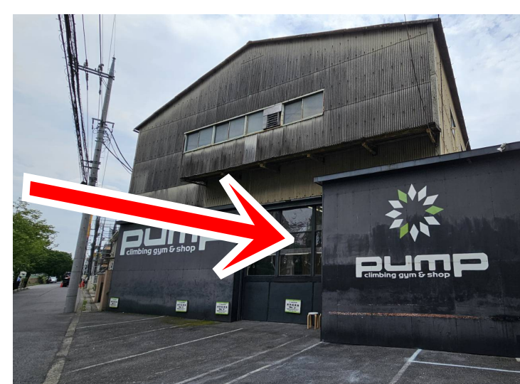
⑧ 約3分ほど川沿いを歩くと到着。 Arrive after walking along the river side about 3 minutes.