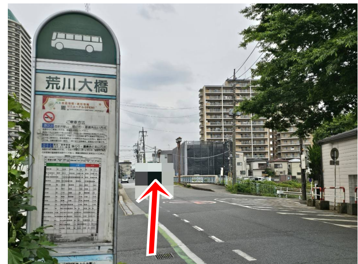
⑥ バス下車後、バス進行方向に約10m進む。 Proceed 10meters in direction of the bus.