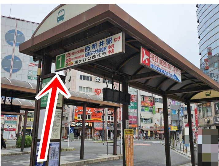
④ バス停(1)荒川大橋・鹿浜経由 西新井駅・西新井大師西駅行きに乗車する。 Take the bus at the "Bus Stop(1)" bound for NISHIARAI Sta./NISHIARAIDAIJI Sta. via ARAKAWA Ohashi.